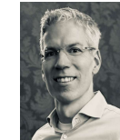
PD B. Habermann